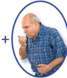
Öksürük ve balgam çıkarma şikayetleriniz varsa