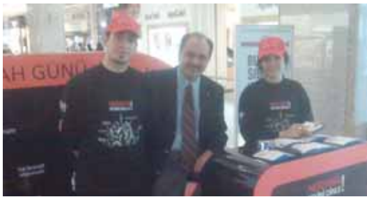
Dünya KOAH Günü dolayısıyla AnkaMall AVM'de kurulan standta broşür dağıtıldı.

bronkoskopik yöntemlerde son derece belirgin ilerlemeler ve yenilikler var. Son yıllarda gündeme gelen bronkoskopik yöntemlerle, akciğer kanseri başta olmak üzere diğer birçok akciğer hastalığının tanısını ve ayrıntılı değerlendirmesini bugün çok rahatlıkla yapabiliyoruz. Türkiye koşullarında maalesef bu gelişmelerin hepsinden tam olarak yararlandığımız söylenemez. Özellikle yüksek teknolojiyi gerektiren ve yüksek maliyetli cihazlarla gerçekleştirilebilen bazı incelemeler ve uygulamalar sadece belli merkezlerde şu an için uygulanabiliyor. Çok yaygın olarak uygulandığını söylememiz mümkün değil. Ancak bunun ötesinde tedaviye yönelik gelişmelerden bahsedecek olursak, dünyadaki güncel gelişmelere paralel olarak uluslararası organizasyonların ve uzmanlık demeklerinin uyguladığı ve geliştirdiği kanıta dayalı bilgiler ile