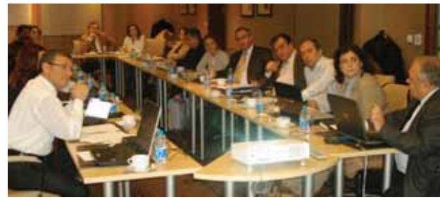
2010 yılı içinde faaliyete başlayan TÜSAD Akademi çeşitli illerde bilimsel toplantılar düzenliyor.

Benim başkanlık dönemimde, en önemli uğraşımız, kurumsal yapılanma sürecinin geliştirilmesi ve 13 Çalışma Grubu ile Koordinasyon kurulları, Dış İlişkiler Komitesi ve Şubelerin oluşturulması ile yatay ve