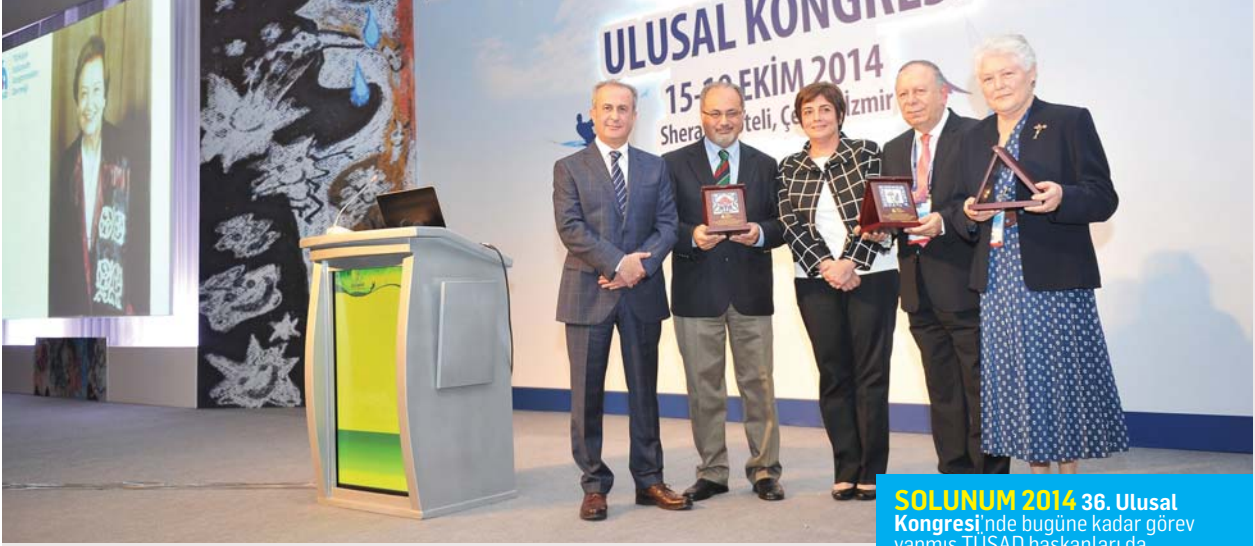
SOLUNUM 2014 36. Ulusal Kongresi ’nde bugüne kadar görev yapmış TUSAD başkanları da bir araya geldi.